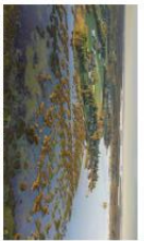
4 Örnstaden och Brändön

Fågelvården är en av de största öarna i Öarna. Här finns en fantastisk natur. Öarna är ett utmärkt ställe för en promenad i skogen. Gammal utbaks fiskesöder i skallet. Vid utlöppet dans för en kvinn.