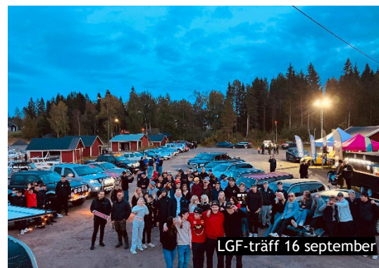
LGF-träff 16 september