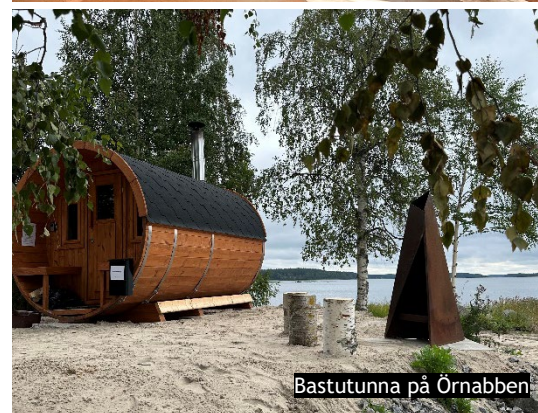
Bastutunna på Örnabben