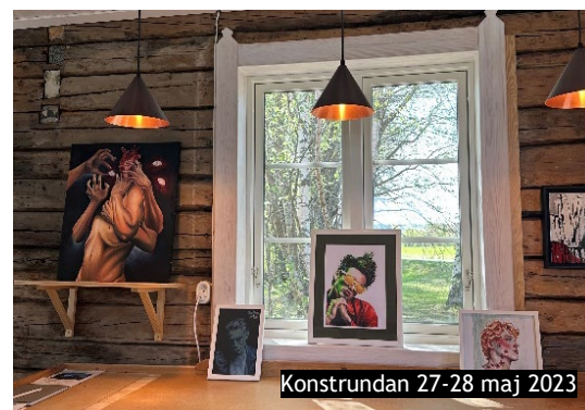
Konstrundan 27-28 maj 2023