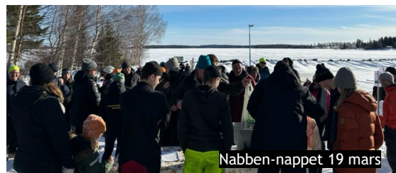
Nabben-nappet 19 mars

Extra glädjande att projektet prisades som Årets landsbygdsprojekt 2023 på kommunfullmäktige med 15 000 kr.