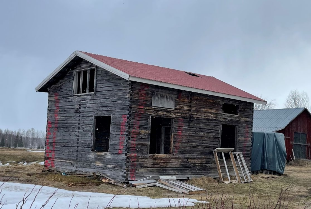
Timringen innan flytt (april 2021)